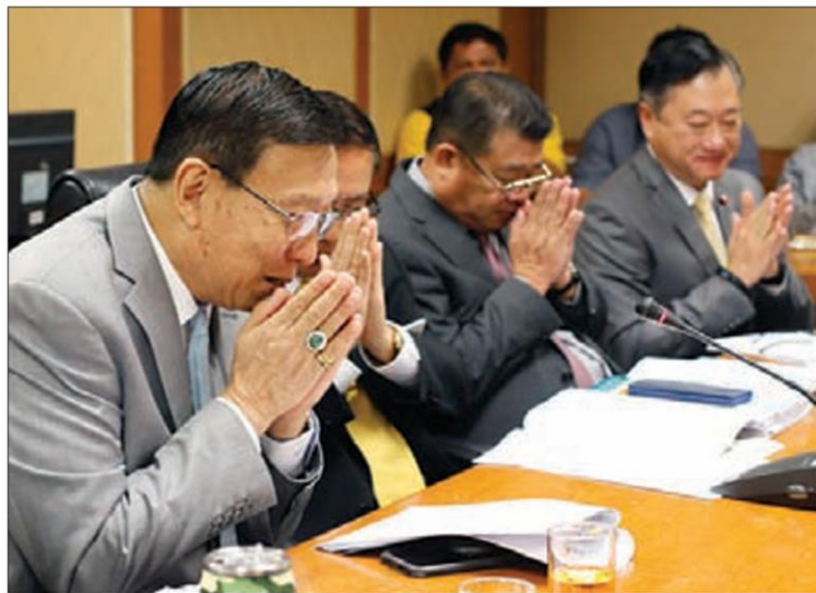
นายพรเพชร วิชิตชลชัย ประธาน สนช. เข้าร่วมหารือกับตัวแทนเครือข่ายชาวนาไทย เพื่อรับฟังความคิดเห็นก่อนจะมีการพิจารณาร่าง พ.ร.บ.ข้าว วาระที่ 2 และวาระ 3 ในวันที่ 20 ก.พ.นี้