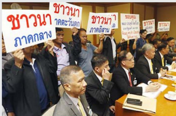
สภานิติบัญญัติแห่งชาติ (สนช.) เชิญตัวแทนเครือข่ายชาวนา เข้าร่วมรับฟังและทำความเข้าใจกรณี ร่างพ.ร.บ.ข้าว ที่จะเข้าสู่การพิจารณาของ สนช. วันที่ 20 ก.พ.นี้ พร้อมยืนยันจะพิจารณาร่างกม.ฉบับนี้ เพื่อประโยชน์แก่เกษตรกรมากที่สุด ที่อาคารรัฐสภา 2 วานนี้ (18 ก.พ.)

ทั้งนี้ นายพรเพชร วิชิตชลชัย ประธาน สนช. ที่เข้าร่วมห้องประชุมตอนต้น กล่าวกับตัวแทนชาวนา โดยยืนยันจะพิจารณาร่าง กม.ฉบับนี้ เพื่อประโยชน์กับเกษตรกรมากที่สุด และพร้อมรับทุกความเห็นมาพิจารณา ส่วนประเด็นที่เป็นข้อวิจารณ์ รวมถึงถ้อยคำที่ยังคลุมเครือ ที่ประชุม สนช. จะช่วยกันพิจารณาเพื่อประโยชน์ของชาวนา